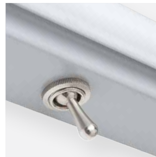
Wahlweise mit seitlichem Ein-/Aussschalter lieferbar

Sonderausführungen und RAL-Lackierungen möglich