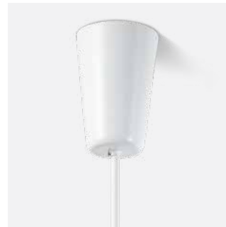
Baldachin in Zylinderform (Größe abhängig von Wattage und Dimmung) mit Pendelrohr Ø 10 mm