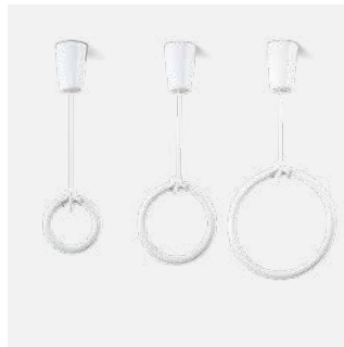
Ringröhre T9 FC in unterschiedlichen Durchmessern

Pendelrohr in Wunschlänge möglich Sonderausführungen und RAL-Lackierungen möglich