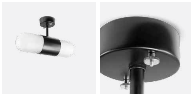
Schraubverbindungen Messing vernickelt

Pendelrohr in Wunschlänge möglich Sonderausführungen und RAL-Lackierungen möglich Zylindergläser auch in klar 18-k erhältlich